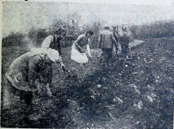
К.муна „Червні зорі“ (Харківщина). Саджають картоплю.

Сільське господарство України вступило в вивершувальний четвертий рік першої п'ятирічки з величезними досягненнями, що їх здобуто на базі