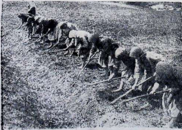
Радгосп ім. Буденного (Харківщина). Полюють на городях.

В організації прополювання має також велике значення визначення ущільнених строків. Це особливо важить цього року, коли zarazом доведеться обробляти чималу площу, коли через велику кількість опадів бур'яни ростуть надзвичайно хутко. Вкласитись в ущільнені строки, значить справді найраціональніше використовувати всі важелі.