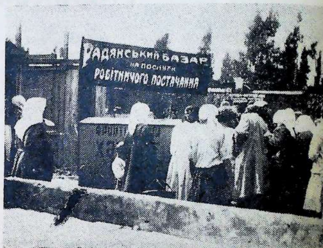
Торгівля городниєю на радянському базарі біля ХПЗ в Харкові

Сільрада повинна по-більшовицьки здійснювати одну з основних своїх функцій організації та контролю і перевірки реалізації останніх історичних постанов партії і уряду, які спрямовані на поліпшення постачання широких мас робітників, колгоспників і трудящих одноосібників, на подальше організаційно-господарське зміцнення колгоспів, водночас нещадно борючись з всілякими спробами