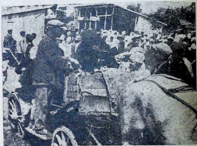
Колгоспники колгоспу „Шлях Леніна“ (Харківщина, на радянському базарі)

Нам треба цього року скосяти 3309 тисяч гектарів сіножатей. Цієї кількості на селянській сектор (колгоспи, одноосібники) припадає 2725 тис. га. Нам будемо треба зібрати щонайменше 6624 тисячі тонн сіна, проти торішніх 5255 тис. тонн.