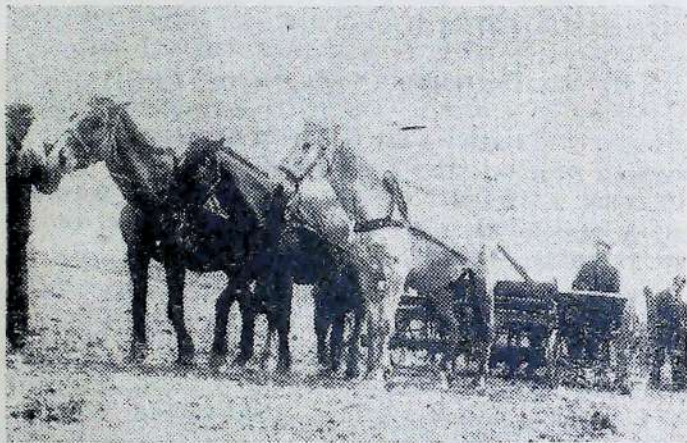
Радгосп ім. Дзержинського (Київщина). Краща бригада сіяч в

Нечуване зменшення кінського поголів'я примушує нарешті серйозно взятись за коня . Що спричинилося до такого жахливого зменшення кінського поголів'я? Однією з таких причин є жорстока класова боротьба в умовах колективізації села. Оскаженілий куркуль на селі в смертельних агоніях чинив, а подекуди й чинить опір, знищуючи «пачками» кращих коней, аби тільки вони не дістались колгоспам.