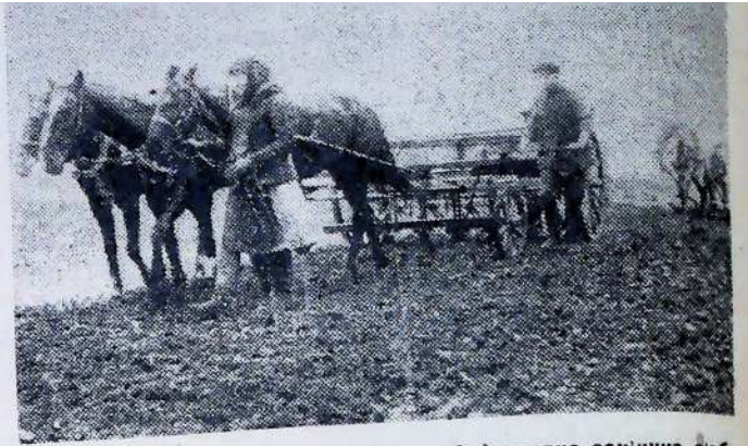
Комуна ім. Петровського (Київська обл.) ударно закінчує сівбу цукрових буряків

Величезне значення в організації поліпильної кампанії має громадське харчування на полі. А треба сказати, що саме тут є безліч неподобств, в багатьох районах люди не здають собі справу у вазі такого заходу, це значить, що там опортуністично плывуть самопливом, не організують всіх сил на прополювання. Треба оголосити найрішучішу боротьбу занедбанню матеріально-побутового обслуговування бригад на полі.