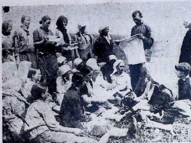
Комуна ім. Сталіна на Харківщині. Комунари опрацьовують постанову ЦК та РНК про колгоспну торгівлю

вати магазини та крамниці і вимагає «всіляко викоринувати перекупників і спекулянтів».