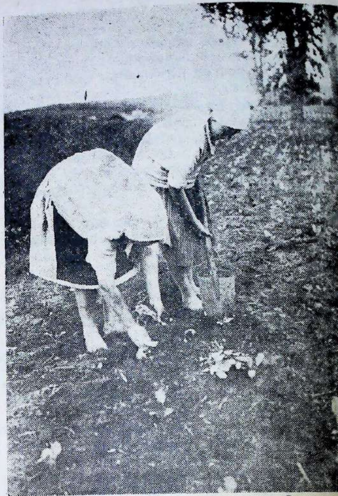
Радгосп ім. Буденного (Харківщина). Саджають капусту на городках

Треба забезпечити більшовицькі темні і виявити творчу ініціативу в цій найважливішій для успішного виконання польових робіт—справі. Комсомольські організації повинні приділити увагу