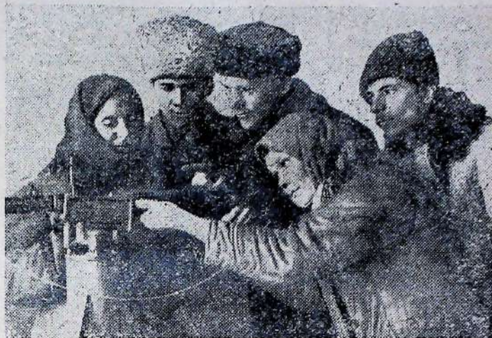
Воєнна робота на селі

Посилення безпеки нових воєн в усією гостротою ставить питання про готування до наступних іспитів. Потрібна ще напруженіша робота цілого особового складу армії коло завоювання нових висот бойового та політичного готування, опанування бойової техніки.