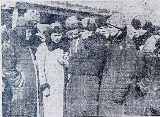
Формування ударної бригади

В колгоспах, сотнях, кутках при залученні широких колгоспників—одноосібників, бідняків, середняків—проробляти плани переведення сівби.