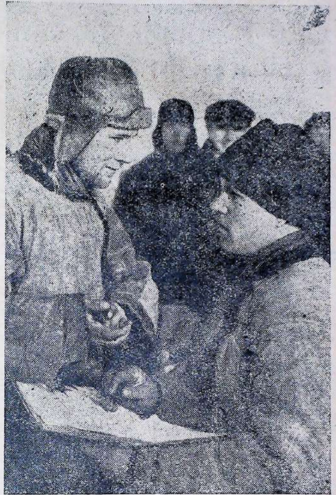
Ударник фінфронту доповідає голові фінсекції

Актив фінсекції складається насамперед з членів секції, членів комісії сприяння, сільської й колгоспних, вербовників ощадкаси й громадських інструкторів держкредиту, комісії сприяння мобілізації коштів (там, де такі комісії є), кооперованих комісії тощо. В актив треба обов'язково втягнути колгосп-