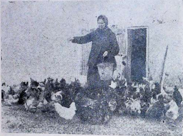
За розвиток птахівництва.—Краща ударниця за годів- лею курей.

Завдання партії—далі розгорнути й зміцнювати артільну форму колгоспів. «Заохочувати товариства всілякого роду, а також сільсько-господарські комуні середніх селян, представники радянської вла-