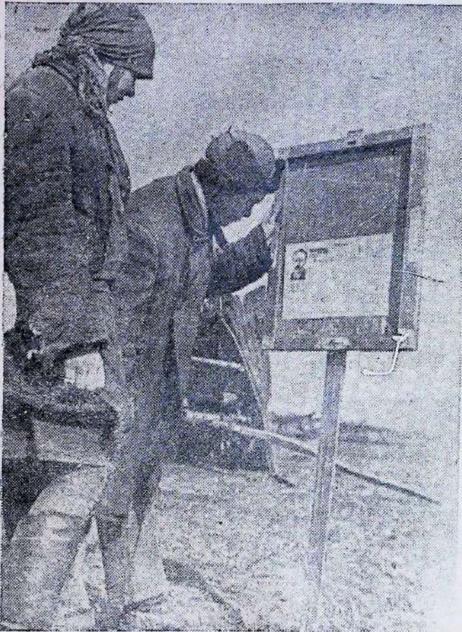
Голі-Прістанський район.—Колгоспники читають польову газету.

на базі суцільної колективізації в цілому СРСР. Цього досягли ми лише в жорсткій класовій бороть-