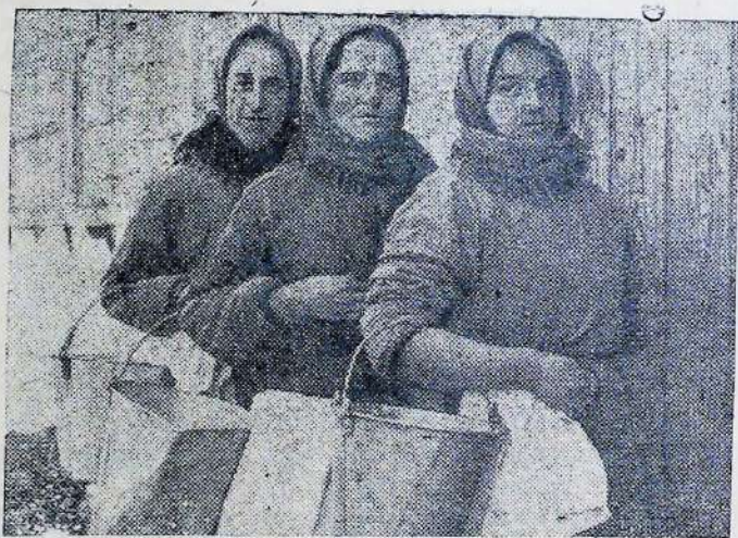
Комуна „Червоні зорі“ (Сокольники). Ударна група доярок.

Далі т. Сталін зазначав «Як могли виникнути серед нас ці толовотепські вправи щодо «усуспільнення», ці сміхотворні спроби перестрибнути через самих себе, спроби, що мають за мету обійти кляси і клясову боротьбу, а насамперед ллють воду на