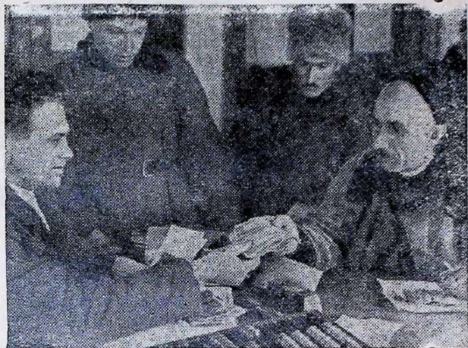
Городищенська сільрада на Харківщині.—Збирають гроші на культурні потреби.

Секрет успіхів Лозівщини в методах її роботи, в справжній масовості, в залученні і до фінансової